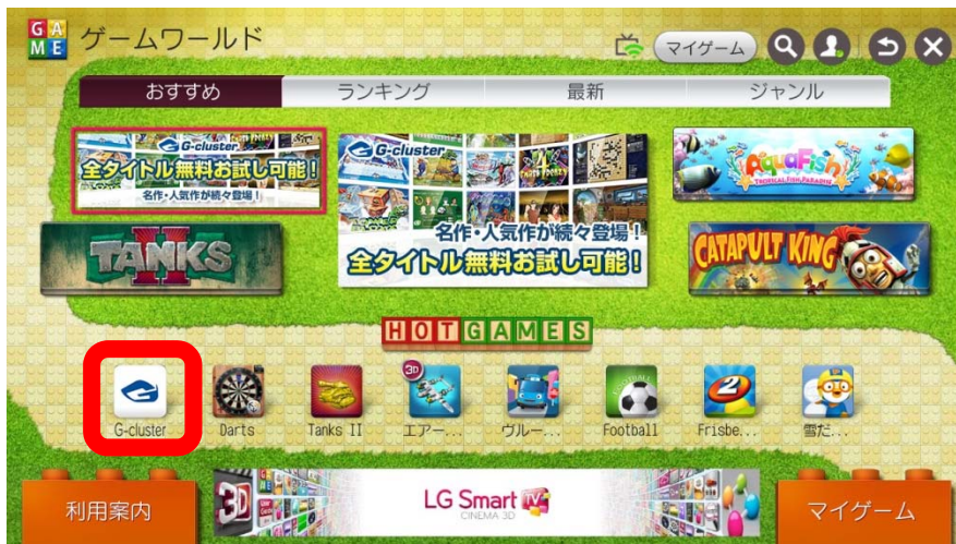
「Gクラスタ」トップ画面