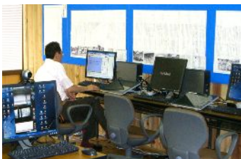
【 ブロードバンドが整備された教室 】