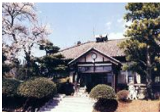
【 茨城県本校 校舎 】