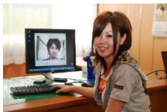
【 e-learning 教室 】