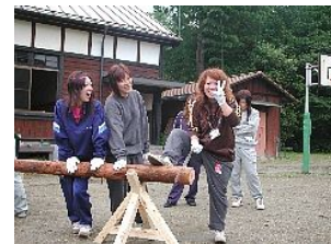
【 スクーリング 体験学習 】