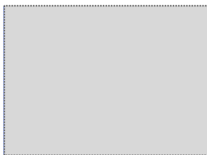
脂肪燃焼ダイエット!『有酸素運動』

なお、4月27日(日)に新宿東口 新宿ステーションスクエアにて、オープニング記念イベントを開催いたします。イベントではインストラクターによるエクササイズ実演や、有名タレントのトークショーを予定しております。