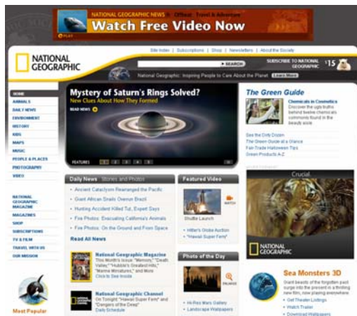
US版のナショナルジオグラフィック Webサイトのトップページ

ナショナルジオグラフィックの掲げる「Inspiring people to care about the planet」という理念に則り、多くの人々がかけがえのない地球に関心を持っていただくための足掛かりとなるサイトを目指していきたいと考えております。