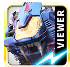
アプリ アイコンイメージ

(C) TOMY ZOIDS is a trademark of TOMY Company, Ltd. and used under license. (C) Broadmedia Corporation. All Rights Reserved.