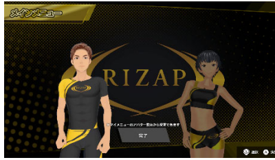
【トレーナー選択画面】