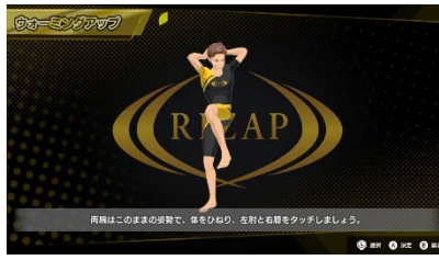
【ウォーミングアップ画面】