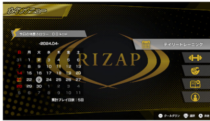
【メインメニュー画面】