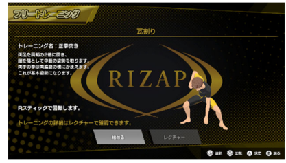
【トレーニング開始画面】