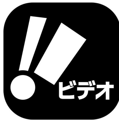
クランクインビデオ 12+ 最新の映画・ドラマ・アニメが楽しめるVODアプリ