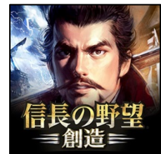
アプリ アイコンイメージ