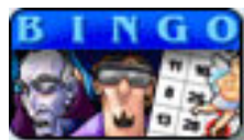
Saints & Sinners Bingo