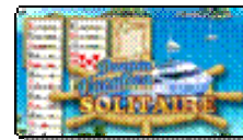
Dream Vacation Solitaire

※上記のゲームタイトルは、オベロン社カジュアルゲームタイトルの一例であり、「G クラスタ」上で提供するタイトルは今後決定します。