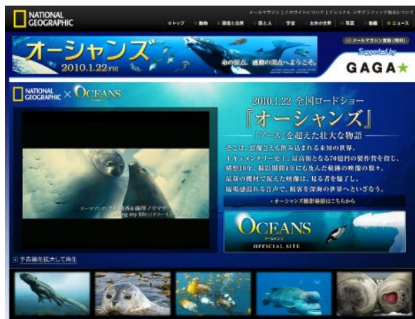
【『オーシャンズ』特集ページ】

「ナショナル ジオグラフィック」は、2010 年も、世界中の自然科学に関する最新ニュース、記事をご提供してまいります。