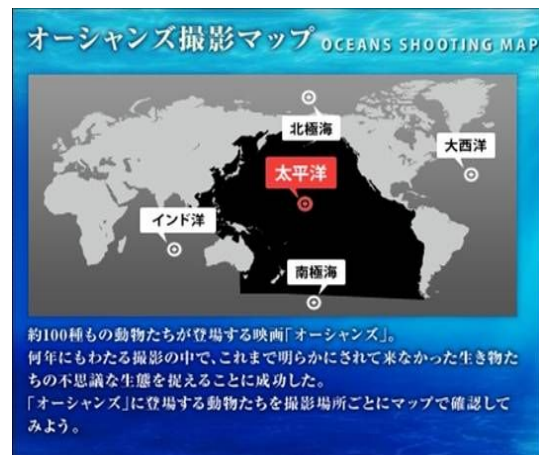
【オーシャンズ撮影マップ】